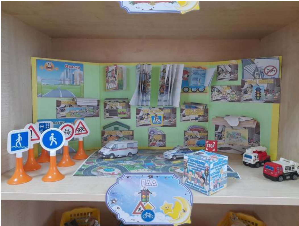
Группа №4 « Звездочки»