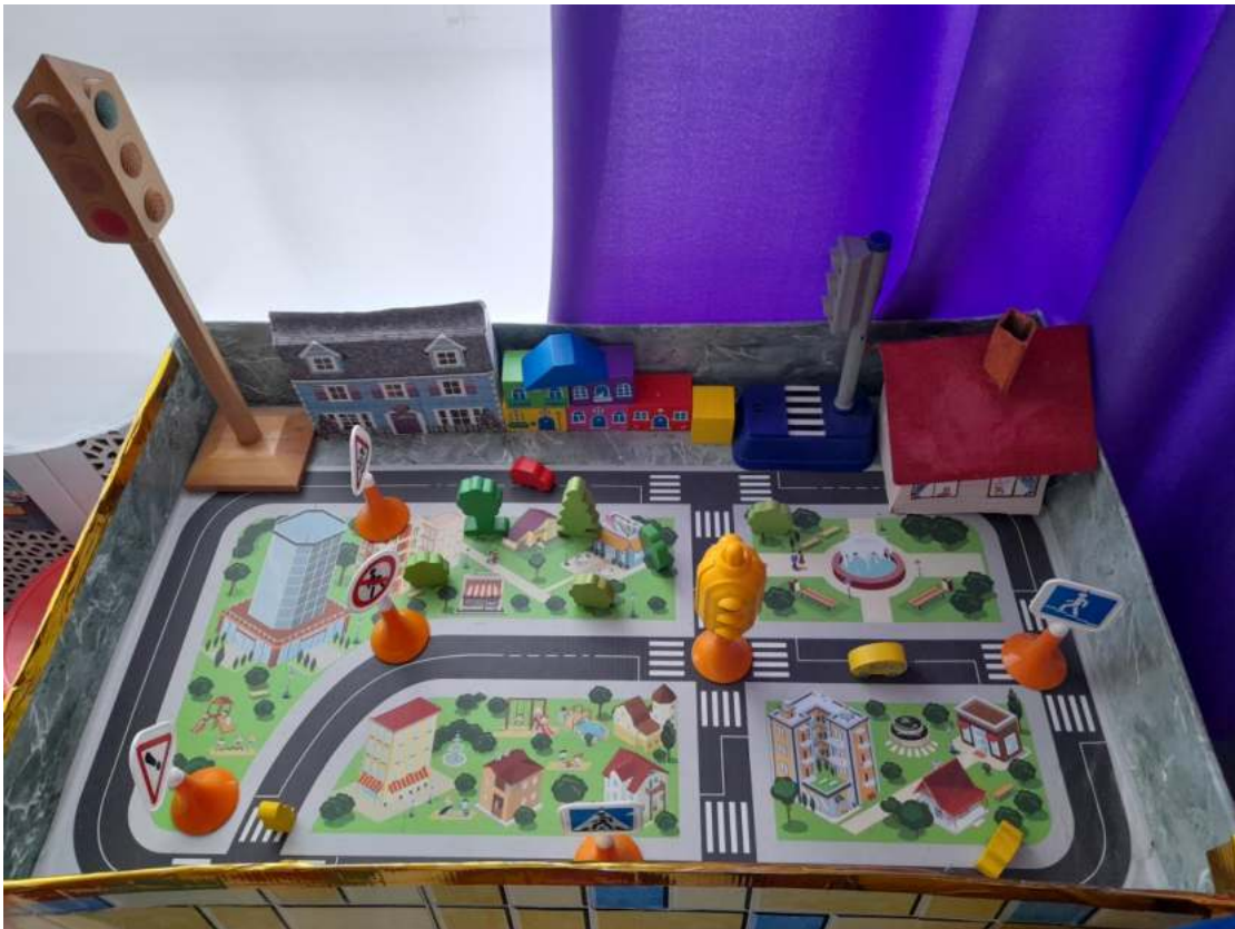
Группа №5 « Паровозик»