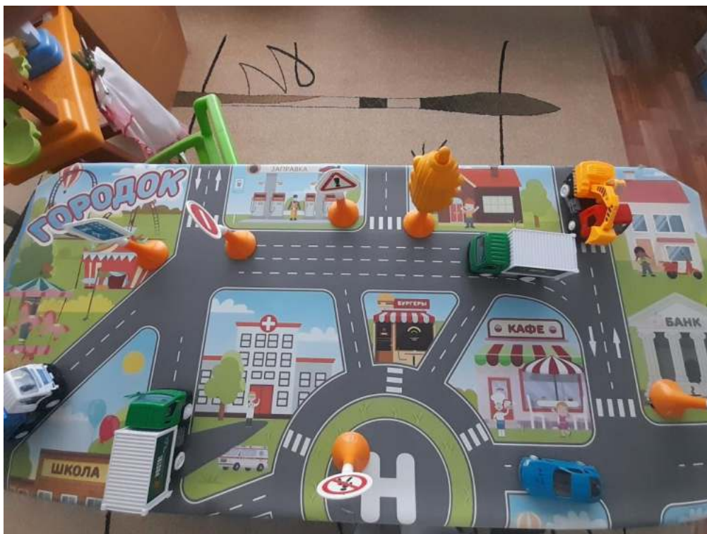
Группа №8 средняя «Кораблик»

Уголки дорожной безопасности в группах ДОУ.