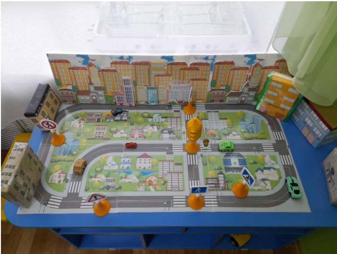
Группа №2 « Полянка»