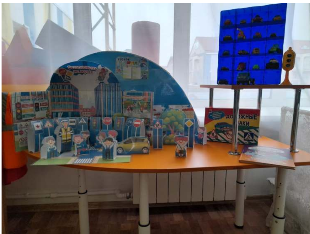
Группа №6 подготовительная «Радуга»