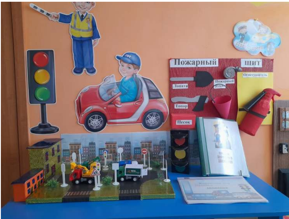
Группа №3 « Цветик-семицветик»